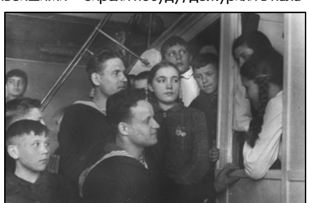
Встреча школьников и пионеров с краснофлотцами. 1941—1945 гг.

Пионеры, оставшиеся дома, помогли Родине «прочным усвоением научных знаний по всем предметам, изжитием неуспеваемости», общественными работами для фронта, в госпиталях, детских садах, с семьями фронтовиков и эвакуированных. На фронт они посылали письма и гостинцы, шили для воинов кисеты, рукавицы, теплые вещи, делали конверты. Для госпиталей собирали посуду, дежурили в пала-