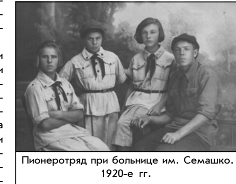
Пионеротряд при больнице им. Семашко. 1920-е гг.

В Нижегородском крае первые отряды появились в 1923 году: например, при Канавинском детском доме № 2 — в феврале, при профсоюзе работников связи и телефонном заводе — в ноябре. Дети в них, как правило, разу-